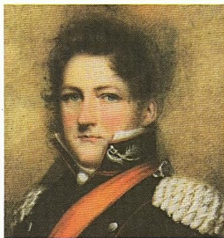
Juan Manuel de Rosas fue gobernador de la provincia de Buenos Aires entre 1829 y 1831, y entre 1835 y 1852.

Relacionar un tema nuevo con datos que ya aprendimos ayuda a comprenderlo.