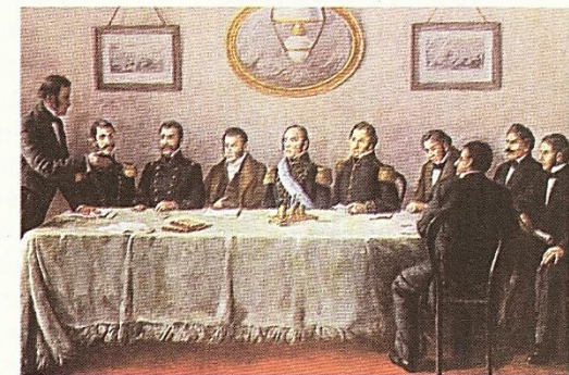
Esta pintura representa el momento de la firma del documento que convocaba al congreso que sancionaría la Constitución Nacional.