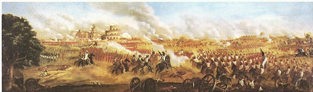
Batalla de Caseros, Final del combate (1856-1857), Juan Manuel Blanes. Esta pintura representa la batalla de Caseros, en la que Urquiza derrotó a Rosas el 3 de febrero de 1852.

pronunciarse: levantarse en contra de un gobierno, promovido por un jefe del ejército o un caudillo.